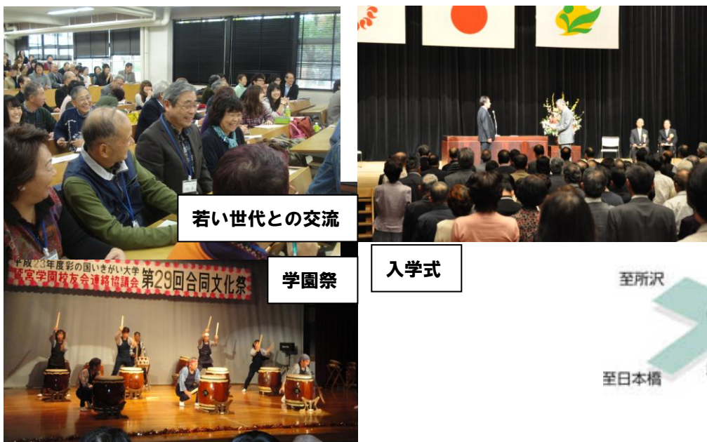
若い世代との交流

今年、8月に行われた山野ビッグバンドジャズコンテスト、最優秀賞受賞！今、ノリに乗っているグループです！